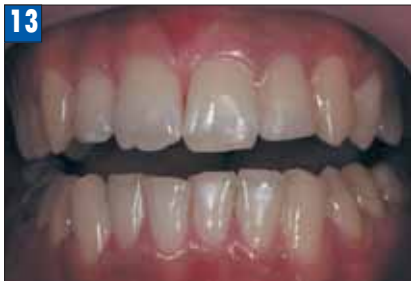
Рис. 13. Зуб 2.2 временная реставрация Protemp™ 4.